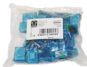
Tabela de características