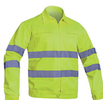
BLUSÃO AV PÁG. 63