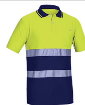
POLO AV BICOLOR M/CUR PÁG. 57