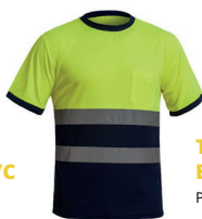
T-SHIRT AV BICOLOR PÁG. 58