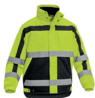
PARKA FORTE AV PÁG. 53