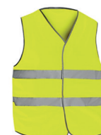
COLETE AV PÁG. 66