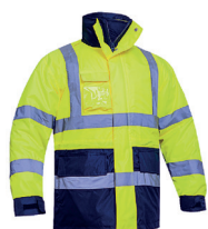
PARKA 4 EM 1 AV BICOLOR PÁG. 62