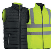
COLETE REVERSÍVEL AV PÁG. 54