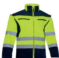
SOFTSHELL FORTE AV PÁG. 55