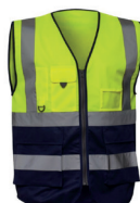
COLETE EXECUTIVA A.V. PÁG. 65