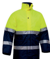
PARKA AV BICOLOR OXF. PÁG. 61