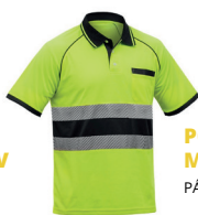
POLO FORTE AV M/CURTA PÁG. 52