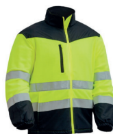
FORRO POLAR FORTE AV PÁG. 53