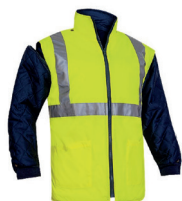
COLETE ACOLC. MAN. DESTACÁVEL PÁG. 64