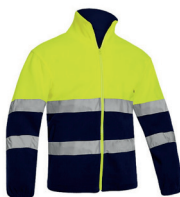
FORRO POLAR AV BICOLOR PÁG. 58