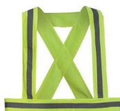
SUSPENSÓRIO AV PÁG. 66