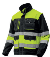
BLUSÃO FORTE AV PÁG. 51