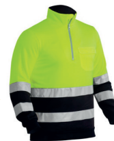
SWEAT AV BICOLOR PÁG. 59