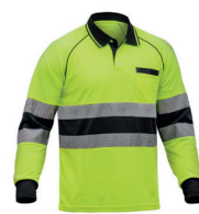
POLO FORTE AV M/COMPRIDA PÁG. 52