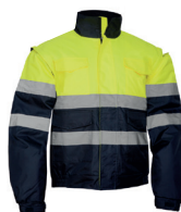
BLUSÃO BOM. AV BICOLOR PÁG. 60