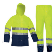
FATO CHUVA AV BICOLOR PÁG. 61