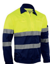
BLUSÃO AV BICOLOR PÁG. 56