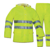
FATO DE CHUVA A.V. AMARELO PÁG. 64