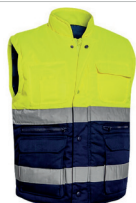
COLETE ACOLC AV BICOLOR PÁG. 59