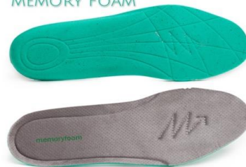
PLANTILLA MEMORY FOAM

ANATÓMICA ANTIESTÁTICA FORRADA CON MICROFIBRA DE SECADO RÁPIDO RESISTENTE A LA ABRASION